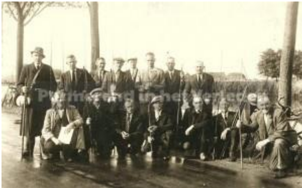
De hengelsportvereniging Afdeling XI-Purmerend poseert aan het Noord Hollands kanaal in 1946 tijdens de finale wedstrijd om het kampioenschap van de club.